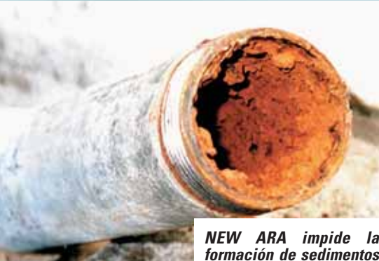
NEW ARA impide la formación de sedimentos y elimina las antiguas incrustaciones.