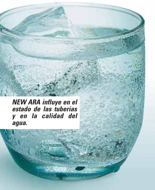
NEW ARA influye en el estado de las tuberías y en la calidad del agua.

calefacción de los electrodomésticos que inevitablemente se cubren de incrustaciones. La potencia aisladora del calizo es que ya con 1 mm de incrustación se obliga a utilizar, para obtener los mismos resultados de calor, el 10% más de energía.